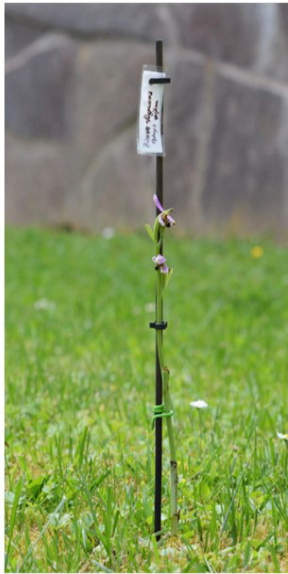
Op. apifera, Wiesenthau, auf Gartenrasen

Es wird belegt, dass vor allem klonal wachsende Orchideen ( Epipactis helleborine , E. atrorubens , Neottia ovata , Cephalanthera damasonium ) sowie die autogame Ophrys apifera ihre ökologische Amplitude und ihre Biotopbindung beachtlich erweitert haben. Zu denken ist in diesem Zusammenhang auch an Aspekte eines Klimawandels. Die etwa 500 Seiten umfassende Zusammenstellung von Wolfgang Heinrich enthält eine Literaturübersicht und erläutert den Kenntnisstand bis 2020.